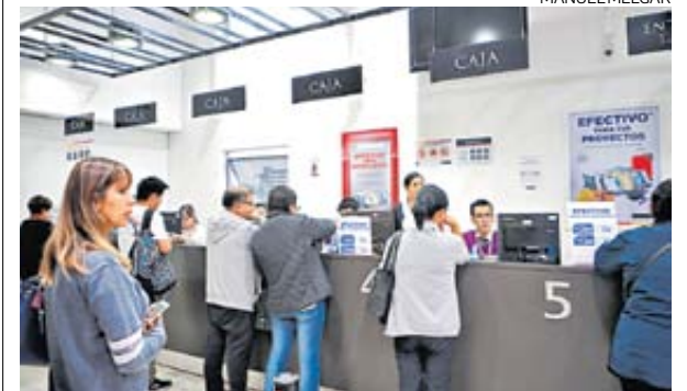
Seguro. El FSD se activa cuando una entidad financiera es intervenida por la Superintendencia (SBS). Todo tipo de cuenta está cubierto.