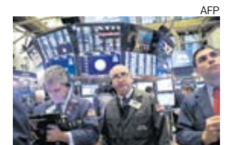
Wall Street afectado por datos chinos.

los miedos de los inversionistas sobre un posible enfriamiento económico a nivel mundial. El dólar también bajó a nivel global.