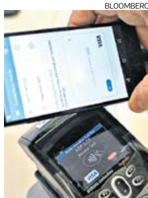
Culqi. Posibilita a los negocios aceptar pagos por Internet.

Los clientes de Culqi pueden aceptar todas las tarjetas